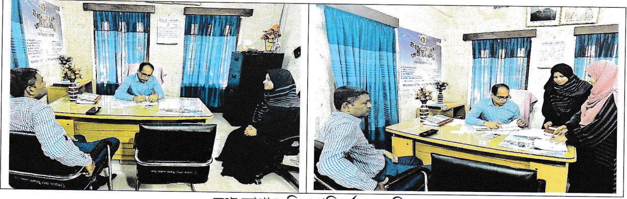
তথ্য আপা অফিস পরিদর্শনের ছবি